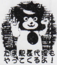
お家駅長代理も やうてくるよ!